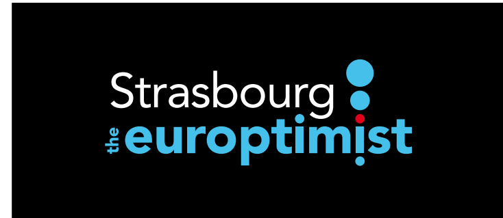
cf fig. 2