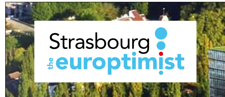
cf fig. 3