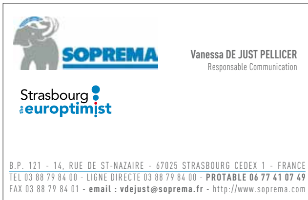
Exemple 2 : avec la couleur adaptée à la dominante du partenaire