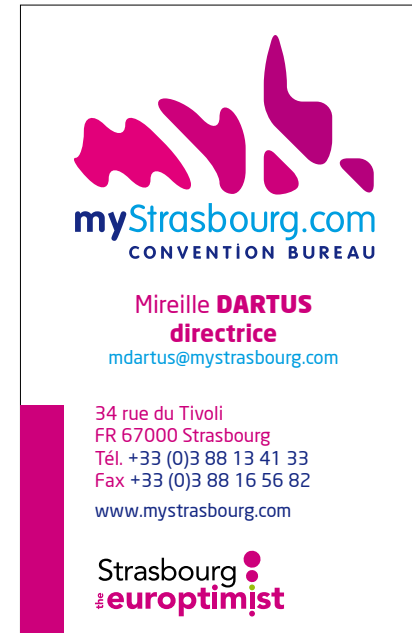
Exemple 3 : avec la couleur adaptée à la dominante du partenaire et le point rouge qui devient vert