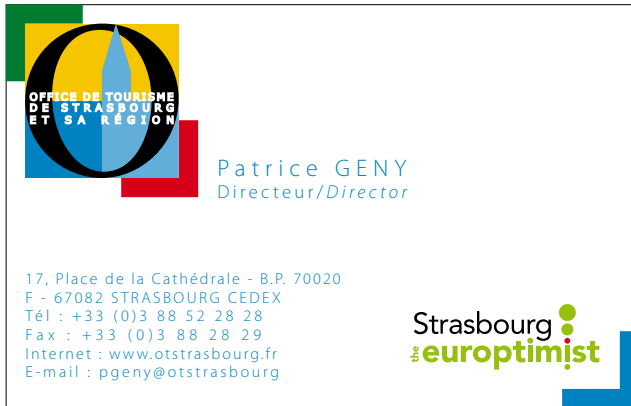
Exemple 1 : avec la couleur du logotype générique

L'emplacement sera variable et se fera en fonction de l'ergonomie existante. Il doit s'intégrer harmonieusement dans la créa de chaque partenaire.