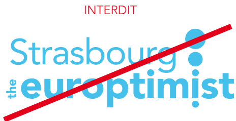
cf fig. 4